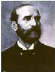
Ανδρέας Συγγρός 1830-1899