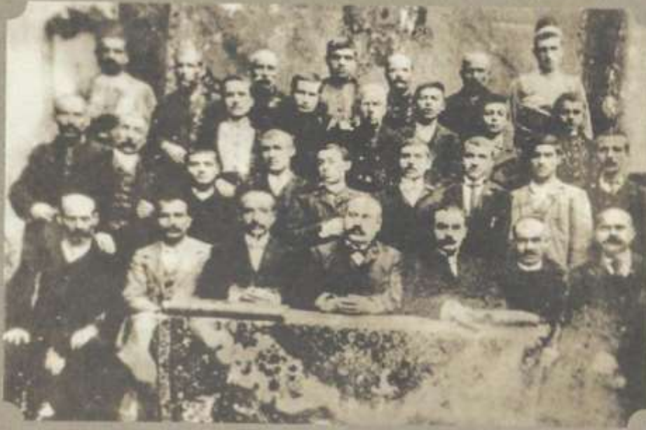
Οι σχεδιαστές του ταπητουργείου Στύλογλου στη Σπάρτη Ψηφιακό Αρχείο Οικογένειας Στύλογλου