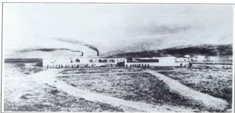
Η Εταιρεία ΠΥΡΚΑΛ του Μποδοσάκη

Δυστυχώς όμως η αλήθεια είναι ότι οι Μικρασιάτες δεν κατάφεραν να αλλάξουν το «παλαιοκομματικό» σύστημα της Ελλάδος το οποίο έχει σωρεύσει άπειρα δεινά στον Ελληνισμό στο σύνολό του και ανανεώνεται καθιστάμενο όλο και πιο εθνικά επικίνδυνο όσο περνούν τα χρόνια.