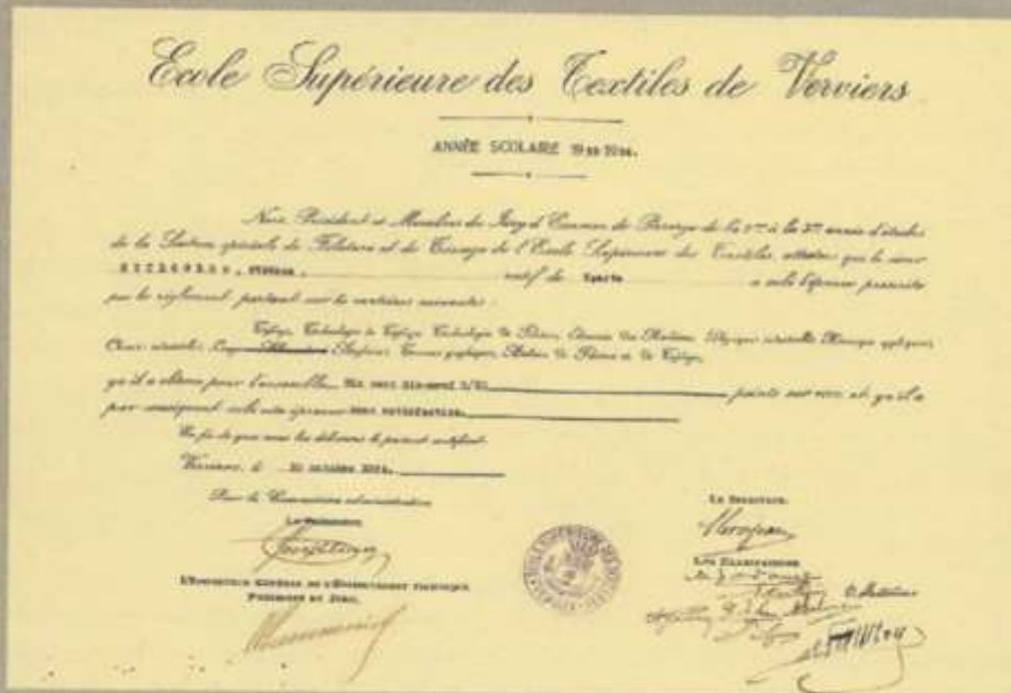
Το δίπλωμα του Σταύρου Στύλογλου από την εριουργική σχολή της Verviers Ψηφιακό Αρχείο Οικογένειας Στύλογλου

Οι σχεδιαστές της ταπητουργίας της Οικογένειας Στύλογλου στην Σπάρτη Πισιδίας και το Δίπλωμα Εριουργικής του Σταύρου Στύλογλου